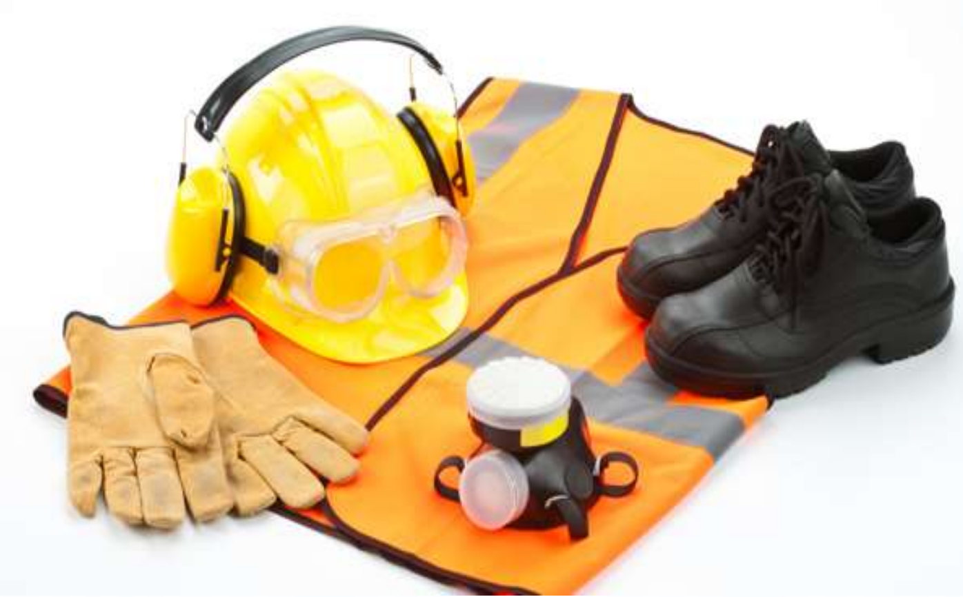
Kişisel Koruyucu Donanımlar (KKD)