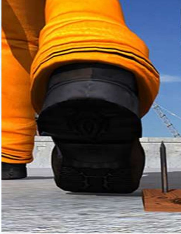
Ramak Kala Olay